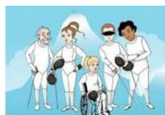
Compagnia della Scherma Lombarda